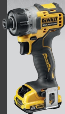
* Само уреда DCF601N