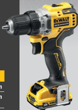
* Само уреда DCD701N