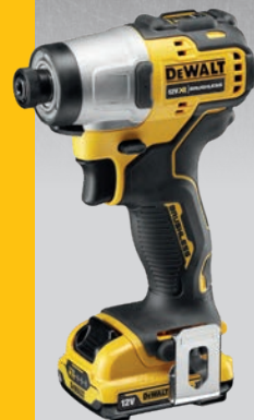
* Само уреда DCF801N