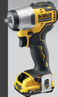
* Само уреда DCF902N