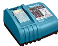
Зарядно устройство DC18RA (1x )