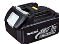
Акумулаторна батерия (2x )