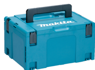
Куфар тип Макрас (1x )